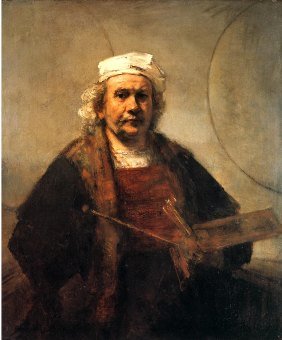
Rembrandt Harmenszoon Van Rijn, dit Rembrandt (1606-1669) Autoportrait , vers 1661 Huile sur toile English Heritage, Kenwood House, Londres