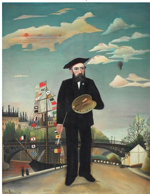
Henri Rousseau Moi-même, portrait paysage

Huile sur toile (1870) Narodni Galerie, Prague