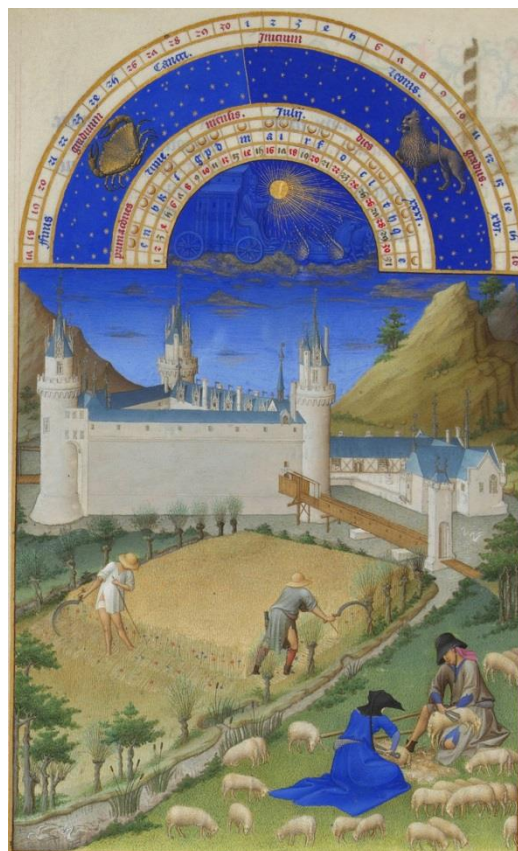
Les Très Riches Heures du Duc de Berry, Juillet, 1411/1416