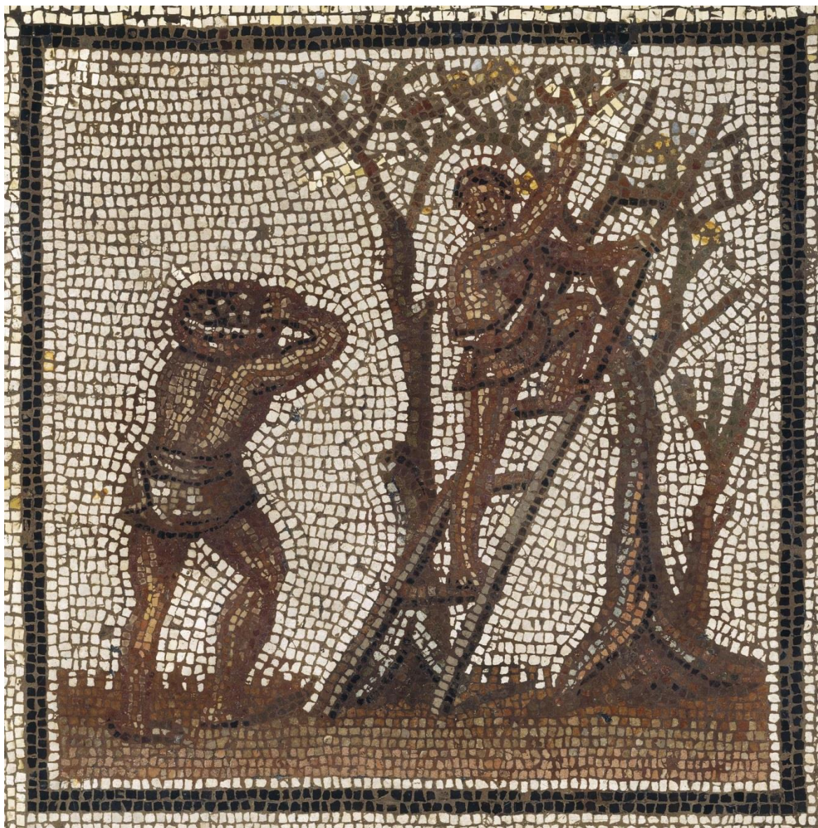
Mosaïque du calendrier agricole de Saint-Romain-en-Gal détail : "La cueillette des olives"